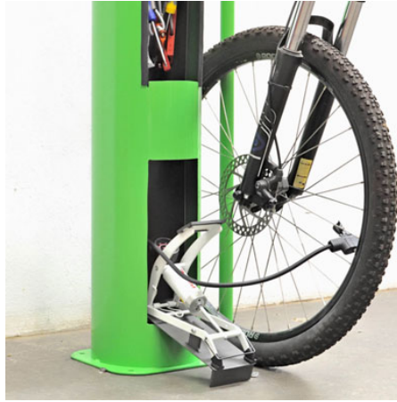
Herramientas de la mejor calidad