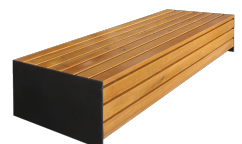
Arq B UM384B

+49 (0) 521 450 131-2 | mb@bas-mobilier.de