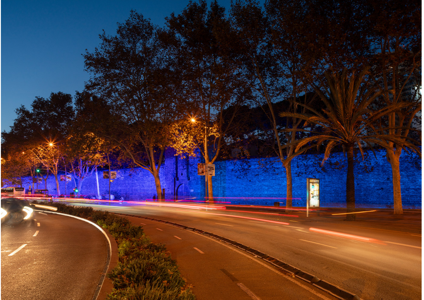
MILAN XL RGBW APMXLR

Se han instalado proyectores RGBW en el portal de Santa Madrona de Barcelona para iluminar la muralla arquitectónica, realzando su belleza y destacando los detalles históricos de la estructura.