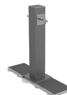
Atlas Doble UM511-2M