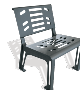
Cadira Essen UM379S