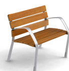
NeoBarcino ALU UM304SAL